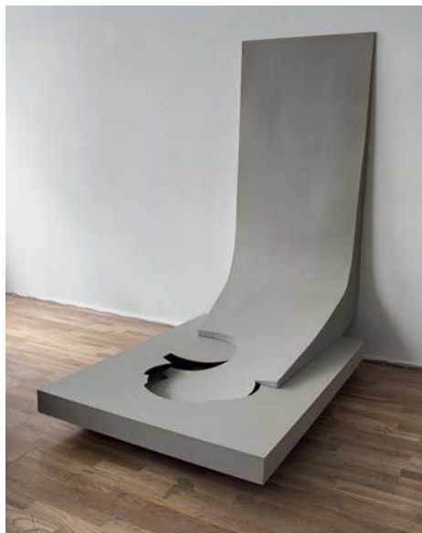
Martina Otto, Transformer , 2011, karton, hout, acrylverf

Dit maakt het openen van de ader positief: het 'living apart together' blijkt nu een mogelijkheid voor de instroom