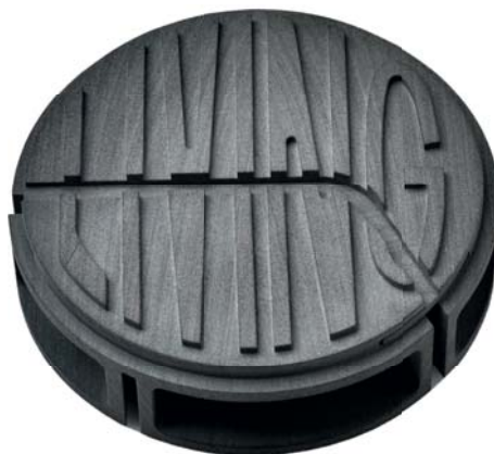
Keerzijde (2/3 ware grootte)