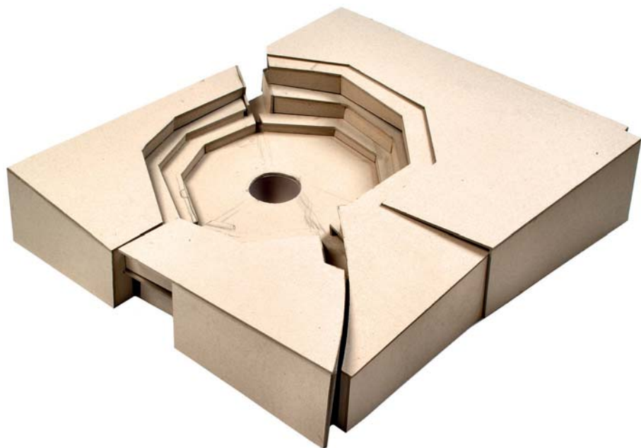
Martina Otto, Sociaal lichaam , 2005/6, karton, potloodtekening

Misschien verwijst voor Martina de ronde vorm van de penning naar de wereld, en de arena naar de stad en de spleet in de penning naar de weg door de stad. En misschien duidt het materiaal op de maakbaarheid van de stad, op de bouw, of in ieder geval op de mogelijkheid